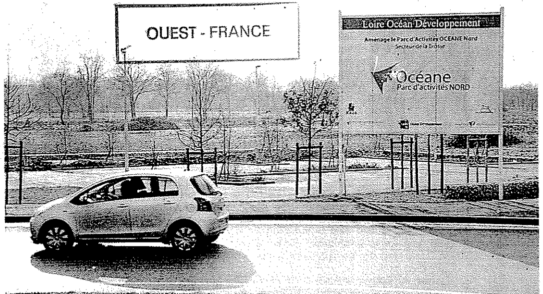
En direction du village de la Brosse, derrière le panneau du parc Océane, pourrait voir le jour un parc de loisirs. Deux groupes intéressés par ce projet vont être reçus par les élus, mi-janvier.

Zone mutualisée. Là encore, ce n'est qu'au stade de projet. Mais l'idée est originale. « Cela pourrait concerner